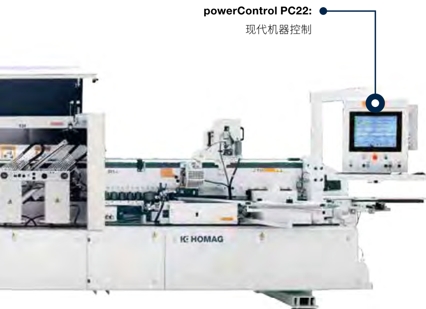
powerControl PC22: 现代机器控制