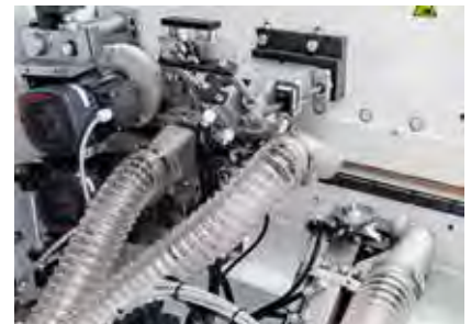
完美的修整单元: 仿形刮刀装置, 平刮刀装置和抛光装置可提高工件的质量。