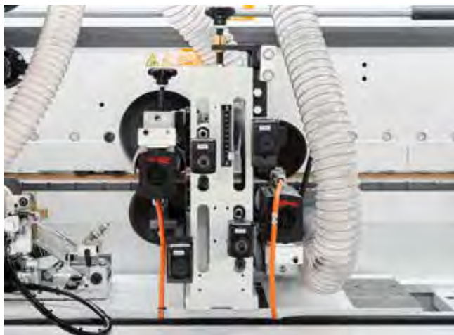
斜角/圆弧精修装置: 手动调节斜角和圆弧加工。